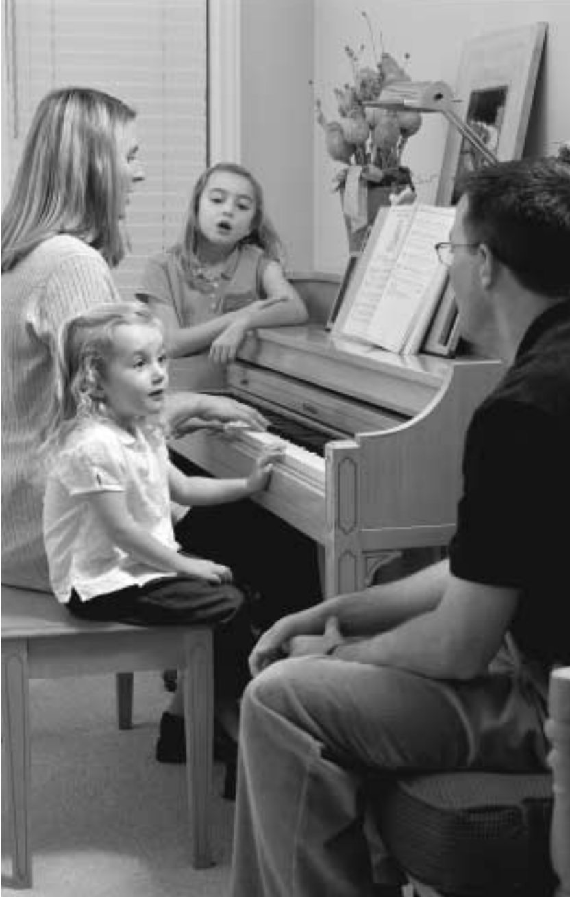
김볼 회장의 제언에 따라 “난 하나님의 자녀”의 후렴은 “제가 언젠가 주와 함께 살도록 해야 할 모든 것을 가르쳐 주소서(영문)”로 끝난다.