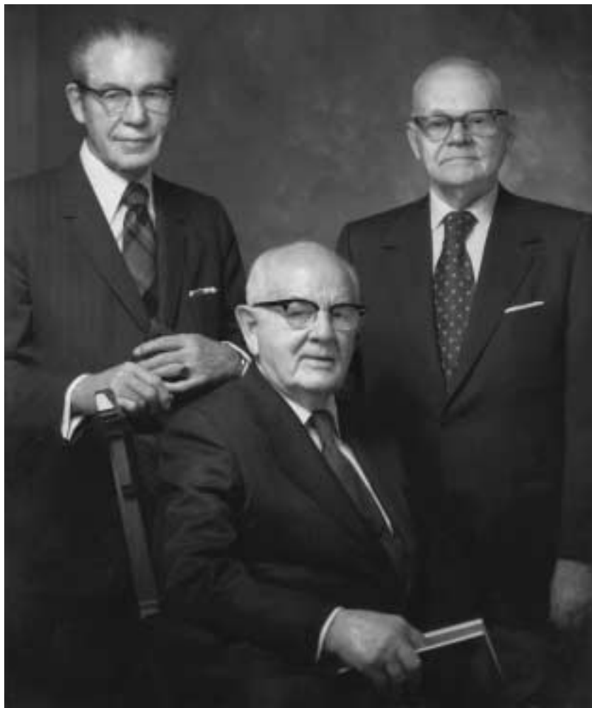
스펜서 더블류 김볼 회장 (가운데)과 함께 1973년부터 1981년까지 제일회장단에서 봉사한 보좌들: 엔 엘돈 태너 회장(왼쪽)과 매리온 지 롬니 회장(오른쪽)

“형제 여러분, 저는 우리가 할 수 있는 일을 다 행하고 있는지 알고 싶습니다. 우리는 온 세상을 가르치는 것에 대한 우리의 접근법에 만족하고 있습니까? 우리는 144년 동안 복음 전도 사업을 펴 왔습니다. 우리의 걸음의 폭을 넓힐 준비가 되어 있습니까? 우리의 비전을 확대할 준비가 되어 있습니까? ...”