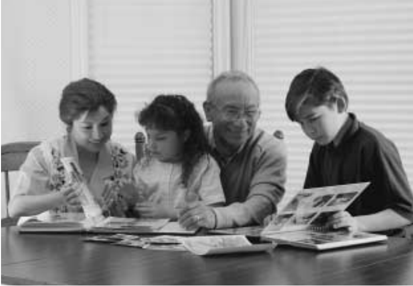
김볼 회장은 안식일은 “가족과 함께 조용히 보내는” 날이라고 가르쳤다.

“내가 그 땅에 평화를 줄 것인즉 너희가 누울 때 너희를 두렵게 할 자가 없을 것이며”. (레위기 26:2~6) 21