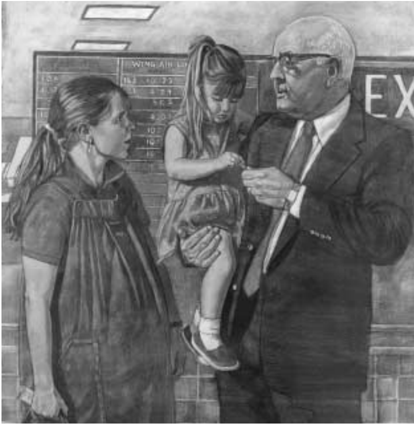
김볼 회장이 시카고 공항에서 배운 단순하고 친절한 행동이 멀리까지 영향을 미쳤다.

그분은 우리와 함께 벤치로 가서 내가 안정이 됐다고 생각될 때까지 한동안 이야기를 나눠 주셨다. 그리고 그분은 갈 길을 가셨다. 약 일주일 후에 나는 스펜서 더블류 김볼 사도의 사진을 보았고, 그가 바로 공항에서 만났던 그분이었음을 알게 되었다.” 2