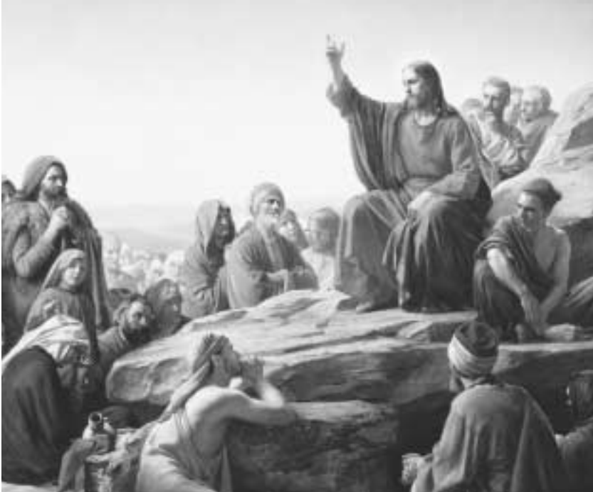
예수 그리스도께서는 이렇게 가르치셨습니다. “너희가 사람의 잘못을 용서하면 너희 하늘 아버지께서도 너희 잘못을 용서하시리라” (마태복음 6:14)

그 교훈은 오늘날 우리에게도 참된 것입니다. 다른 사람들과 화해를 하게 되었을 때, 많은 사람들이 용서한다고 말하지만, 계속해서 적의를 품고, 계속해서 상대방을 의심하고, 계속해서 다른 사람의 진심을 믿지 않습니다. 이것은 죄입니다. 왜냐하면 일단 화해가 성립되고, 회개가 요구될 때, 각자는 서로 용서하고 잊어야 하며, 무너졌던 관계를 즉시 복구하고, 과거에 있었던 화목함을 회복해야 하기 때문입니다.