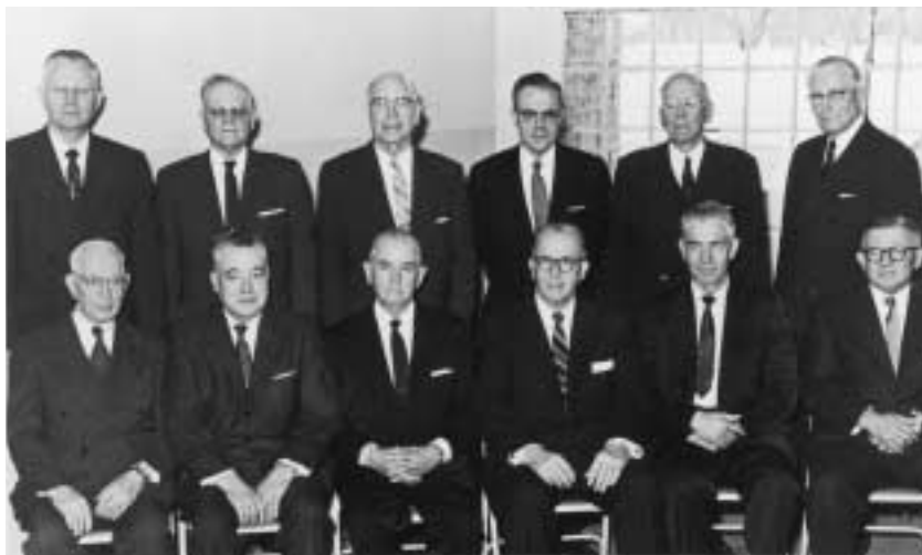
1958년의 십이사도 정원회. 왼쪽에서 오른쪽으로 서 있는 사람: 델버트 엘 스테이플리, 매리온 지 롬니, 리그랜드 리차즈, 리차드 엘 이반스, 조지 큐 모리스, 휴 비 브라운. 왼쪽에서 오른쪽으로 앉아 있는 사람: 조셉 필딩 스미스, 해롤드 비 리, 스펜서 더블류 김볼, 에즈라 테프트 벤슨, 마크 이 피터슨, 헨리 디 모일.

리고 회개하여 완전하고 신성한 용서의 확신을 얻기 위해 따라야 할 길을 설명했다. 김볼 장로는 주님께서 자비로우시며 또한 진심으로 회개하는 사람들을 용서할 것임을 독자들에게 간증했다.