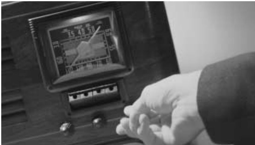
김볼 회장은 신앙을 라디오 주파수를 맞추는 것에 비유했다.

산할 능력을 갖추거나 집에 배선을 하기 위한 지식은 그에게 필요없습니다. 그러나 그는 전등을 구해 오기에 충분한 신앙, 그리고 스위치를 켜기 위한 신앙을 지녀야 합니다. 그렇게 하면 그는 빛을 받을 수 있습니다. ... 그가 라디오를 만들거나 그 작동 방법을 충분히 이해하지 못해도 주파수 다이얼을 돌려서 멀리서 오는 감미로운 음악을 즐길 수는 있지만, 라디오를 전기에 연결하고 다이얼을 올바르게 맞추지 않는다면 그 축복은 결코 받을 수 없을 것입니다. 마찬가지로, 인간은 다이얼을 돌리고 맞춤으로써 영적인 축복과 나타내심을 받을 수 있습니다. 그 열쇠는 바로 기도와 행동으로 인해 나타나는 신앙입니다. 3