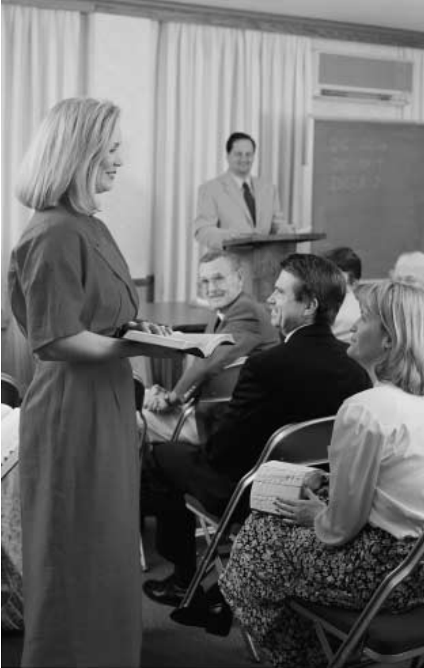
“안식일을 일컬어 즐거운 날이라, 여호와의 성일 ... 이라 하여” (이사야 58:13)