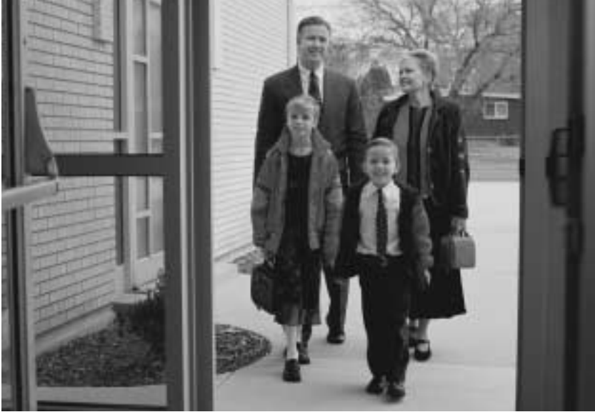
안식일은 “주님을 예배하며 그분께 우리의 감사와 사의를 표현하는 날입니다.”

그고, 거래를 연기하고, 고민을 잊을 수 있는 날입니다. “네가 흠으로 돌아갈 때까지 얼굴에 땀을 흘려야 먹을 것을 먹으리니 …” [창세기 3:19 참조]라는 첫 번째 명으로부터 인간이 잠시 해방될 수 있는 날입니다. 육신이 휴식을 취하고, 마음은 긴장을 풀고, 영이 자랄 수 있는 날입니다. 노래를 부르고 기도를 드리며 설교를 하고 간증할 수 있는 날이며, 아울러 하나님과 그의 피조물 사이에 놓여 있는 시간과 공간 그리고 거리를 초월하여 인간이 높이 오를 수 있는 날입니다.