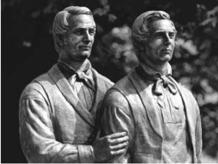
형 하이럼과 함께 1844년에 죽임을 당한 조셉 스미스의 순교는 “예수 그리스도의 복음의 신성에 대한 또 하나의 확실한 증거”이다.

니다. 이 소중한 피는 땅을 적셨고 사람들의 생각과 마음에 계속해서 울려 퍼질 불멸의, 그리고 반박할 수 없는 간증이 인봉되었습니다. 17