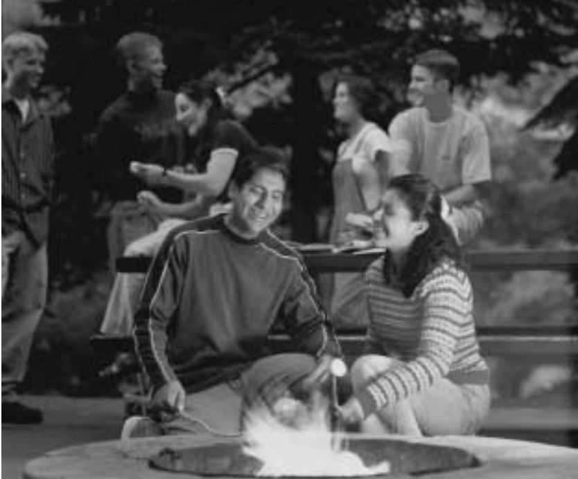
김볼 회장은 데이트하는 젊은이들을 위하여 분명한 지침을 내려 주셨다.

가 이런 훌륭한 일을 기대할 뿐만 아니라, 하늘에 계신 주 예수 그리스도께서도 그들이 깨끗함을 유지하고 부도덕에서 자유롭기를 바라신다는 점을 자녀들은 알아야 합니다. 19