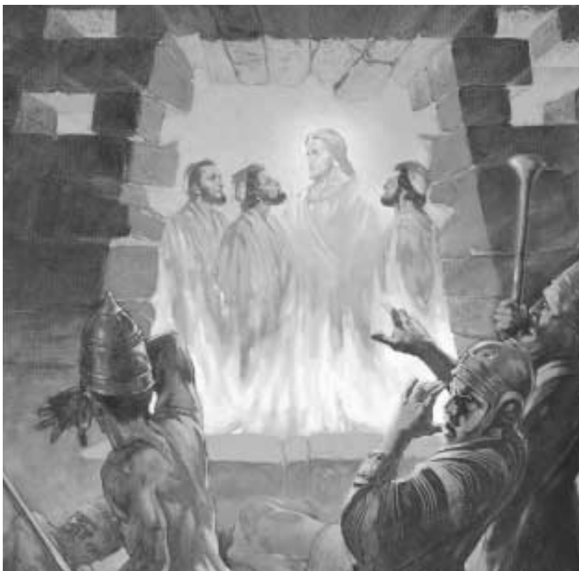
사드락, 메삭, 그리고 아벳느고는 “자신들의 하나님을 거부하기보다는 오히려 맹렬한 풀무 불 속으로 기꺼이 들어갔습니다.” 주님은 그들을 불길에서 구해 주셨습니다.

... 미리 배치된 나팔과 피리와 수금, 그리고 다른 악기들이 그 지역 곳곳에 울려 퍼지고 어디서나, 무릎 꿇고 거대한 금 신상을 예배하는 많은 남녀들이 그들의 가정과 거리를 가득 채웠건만, 이 세 사람은 그들의 참된 하나님을 욕되게 하기를 거부했습니다. 그들은 하나님께 기도를 드렸고, 매우 격노한 왕 앞에 끌려