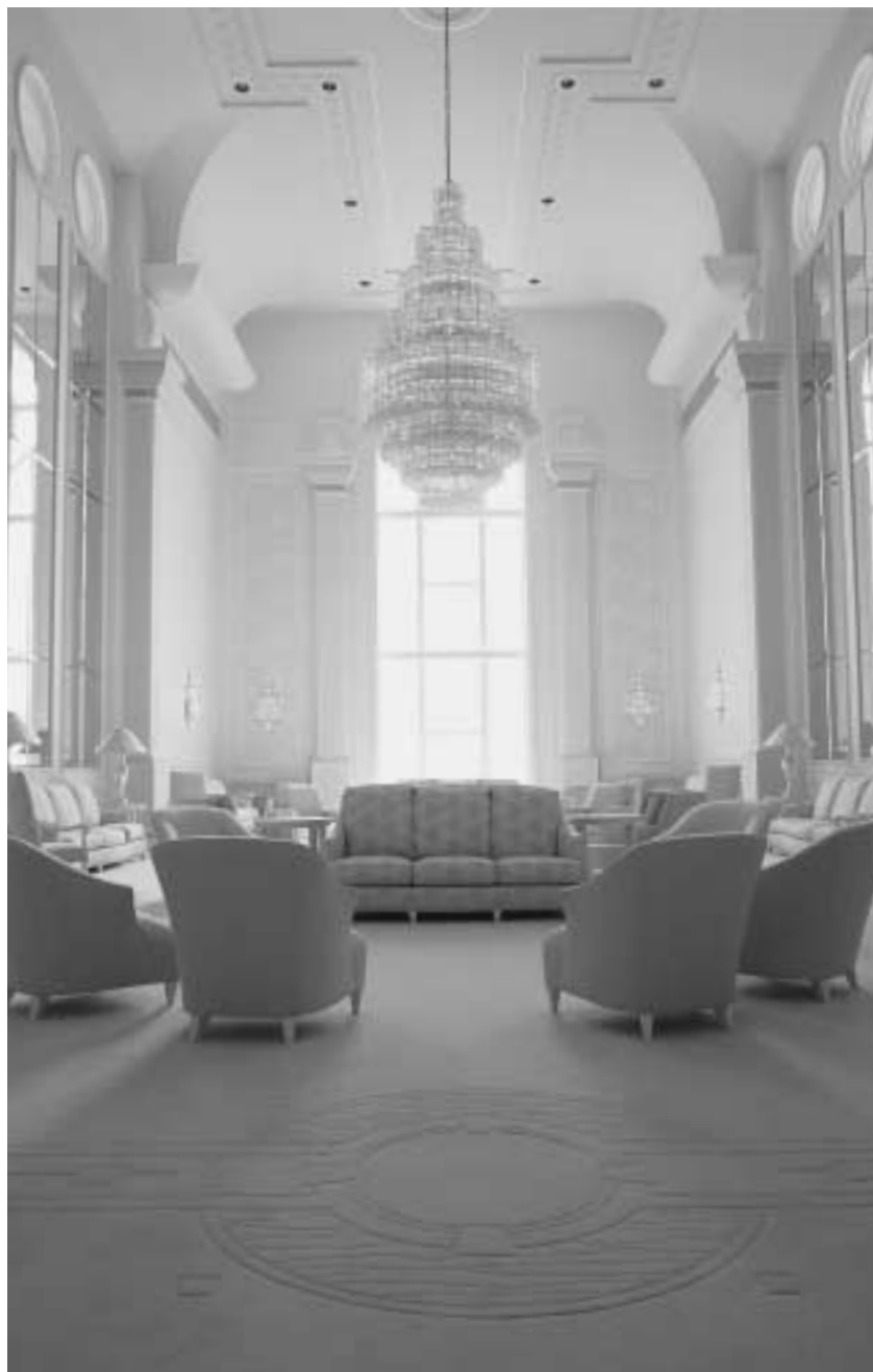
유타 팀파노고스 성전의 해의 왕국실. 김볼 회장은 성전이 “경건한 장소가 되어야 한다”고 가르쳤다.