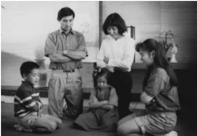
가족 기도는 "가족의 단합과 가족의 결속을 향해 앞으로 내딛는 발걸음입니다."

회를 가져야 하며, 그것은 감리하는 사람, 즉 일반적으로는 신권을 지닌 아버지, 만약 아버지가 없으면 어머니, 그리고 두 분 다 없으면 가장 나이 많은 자녀의 인도로 이루어집니다. 14