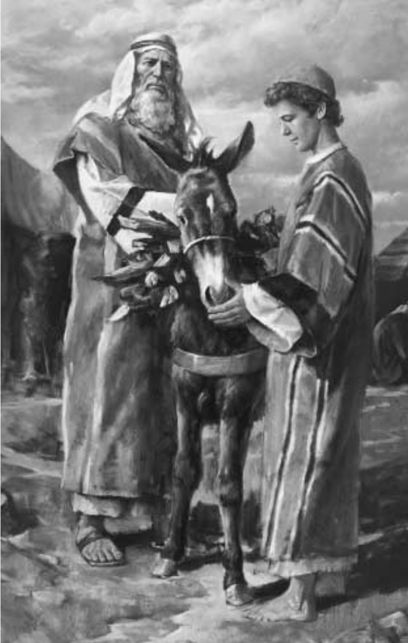
아브라함은 상한 심령과 두려움 없는 신앙으로 그의 아들 이삭과 함께 모리아 땅으로 갔다.