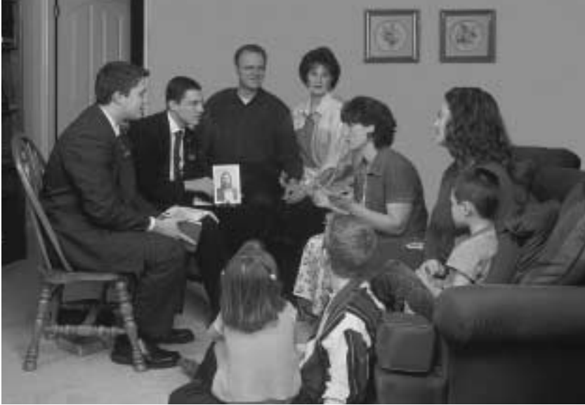
“효과적인 전도의 참된 목표는 회원들이 구도자를 찾고, 전임 선교사들이 가르치는 것입니다.”

효과적인 전도의 참된 목표는 회원들이 구도자를 찾고, 전임 선교사들이 그들을 가르치는 것입니다. ... 회원들이 사람을 찾을 때, 그들은 우정 증진에 개인적인 관심을 갖게 되고, 침례 이전에 잃어버리는 구도자가 거의 없게 되며, 침례를 받는 사람들은 활동적으로 남는 경향이 있습니다. 16