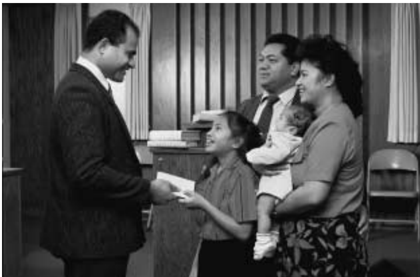
“우리의 임무는 [우리의] 자원들을 가족과 정원회 안에서 활용하여 하나님의 왕국을 세우는 것입니다.”