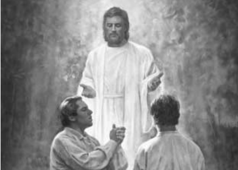
회복의 일환으로 선지자 조셉 스미스와 올리버 카우더리는 부활한 침례 요한으로부터 아론 신권을 받았다.

러 해를 거치면서 이러한 시현들과 계시들이 계속되었고, 그 과정에서 여호와와 음성이 거듭해서 다시 들렸으며, 이 젊은 선지자를 통해 복음의 진리, 하나님의 신권, 사도의 직분, 권세와 권능, 교회의 조직 등이 지상에 회복되었고, 이리하여 계시와 영원한 진리가 다시 지상에 있게 되었으며 또한 그것들을 받아들이게 될 모든 사람들에게 전해지게 되었습니다. 11