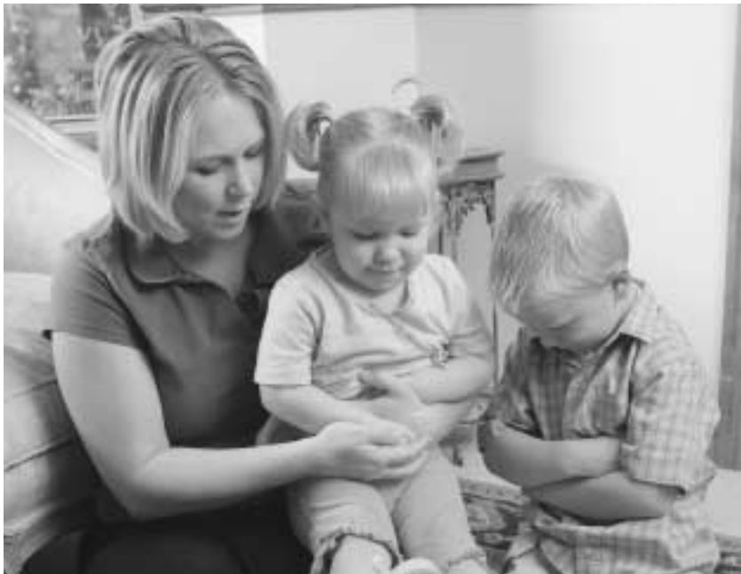
“가정에서 배운 태도가 교회 모임에서의 행동을 결정합니다.”

어린 자녀들이 있는 부모는 때때로 어린이들이 모임을 제대로 인식하도록 돕고 소란을 일으키지 않도록 하는 데 어려움을 겪습니다. 참율성과 단호함, 그리고 가정에서의 준비는 성공을 위한 필수 요소입니다. 교회에서 자녀들을 다루는 방법을 모르겠다면, 젊은 부모들은 와드에 계시는 경험 많은 부부에게 조언을 구할 수도 있습니다.